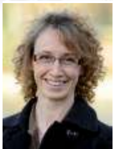
Par Stéphanie Médan