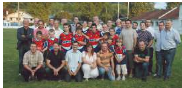
Les éducateurs et les jeunes.