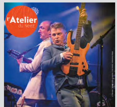
LES FRÈRES JACQUARD 13 mars 20h30