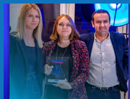
JULINE ARMAND PHOTOGRAPHIE

En les décernant, la CCI entend « mettre à l'honneur les commerçants qui font rayonner notre territoire par leur audace, leur engagement et leur sens du service ». Parmi les initiatives locales innovantes et les parcours inspirants mis à l'honneur, Juline décroche le Trophée de l'Innovation. Voilà qui est cohérent et bien mérité !