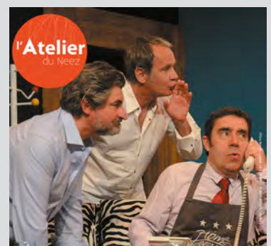
LE DÎNER DE CONS 7 mai 20h30