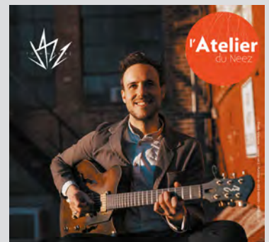
GILAD HEKSELMAN TRIO 24 avril 20h30