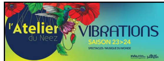
Bandeau web 23-24