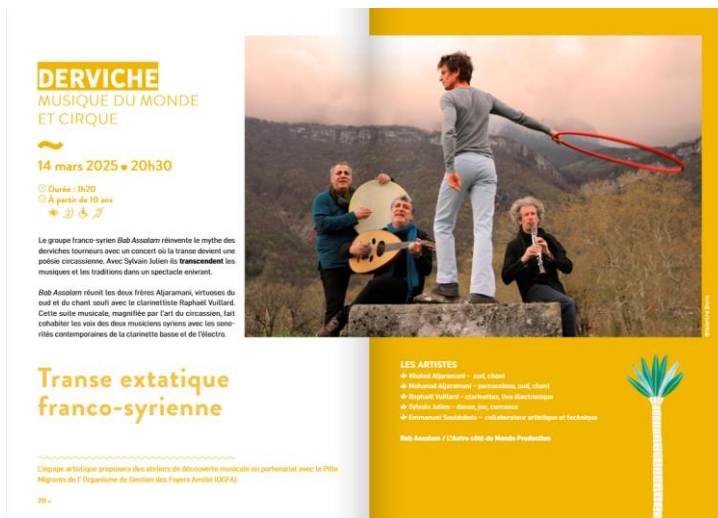
Plaquelette 24-25 : Atelier du Neez - Saison 2024-2025