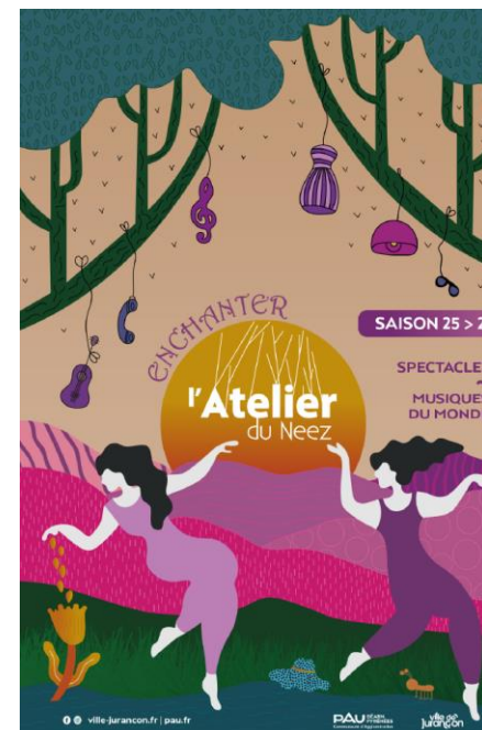
Carton d'invitation à la soirée de présentation de la saison 25-26