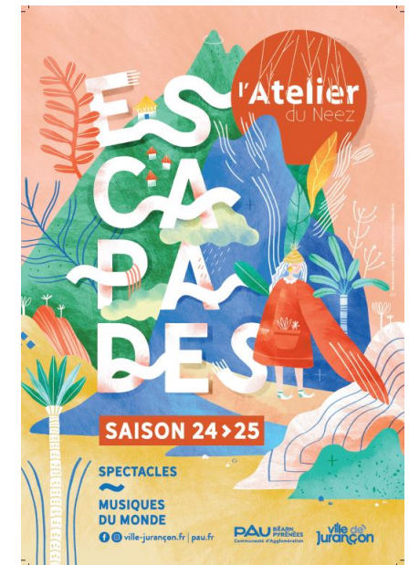
Affiche générique 24-25