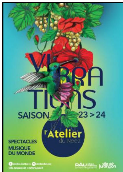
Affiche générique 23-24

Pictogrammes réseaux sociaux / Sites internet / Logos CAPBP et Ville de Jurançon.