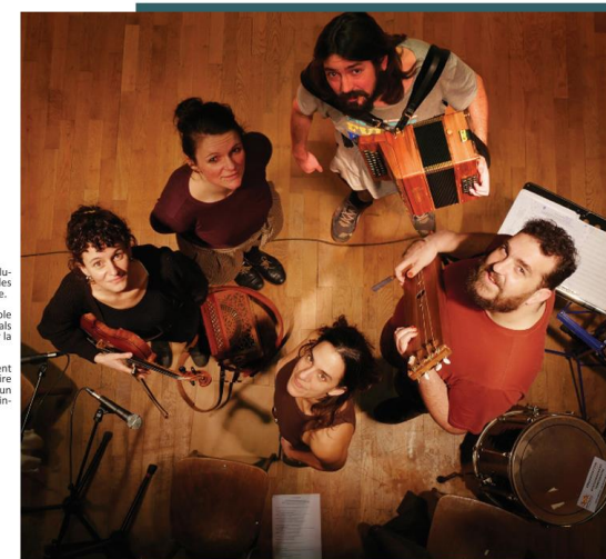
En partenariat avec l'association Tiss Liens 64, l'équipe artistique mènera une initiation de danses du Pailou et des ateliers autour de la danse trad dans le cadre de Trajectoires.

Production et diffusion - La D'âme de Compagnie