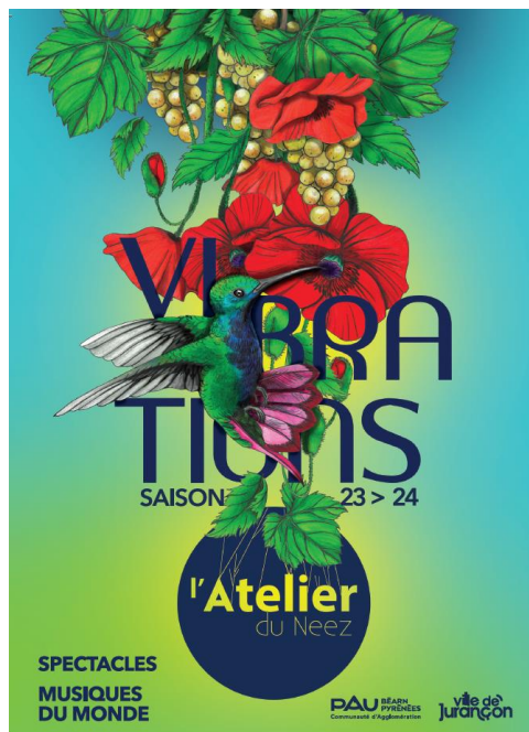
Flyer recto/verso d'annonce de la soirée de présentation de la saison 23-24

Le carton d'invitation est une simple reprise du visuel saison avec le texte que nous vous fournirons.