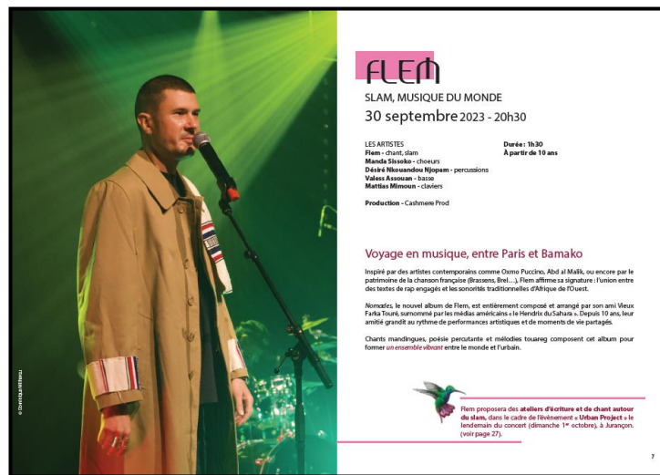
Plaquelette 23-24 : https://tinyurl.com/feuilletableAN

De façon générale, le texte est minoritaire par rapport au visuel qui doit jouer un rôle promotionnel soit être esthétique, attirant, interroger, séduire.