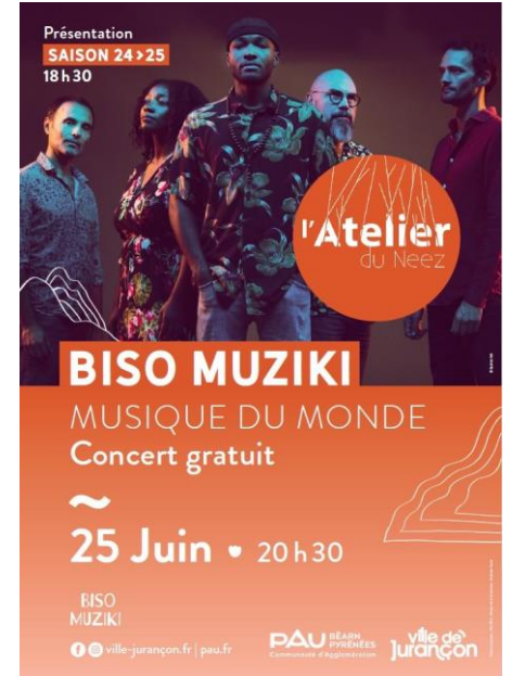
Affiche de la soirée de présentation de la saison 24 > 25