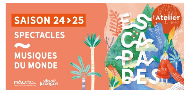
Bandeau web 24-25